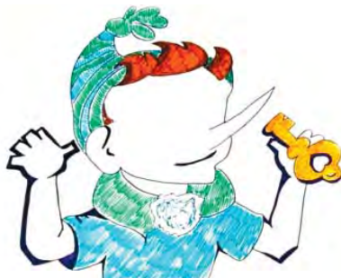
Рис. П2.3. Пример «Буратино»